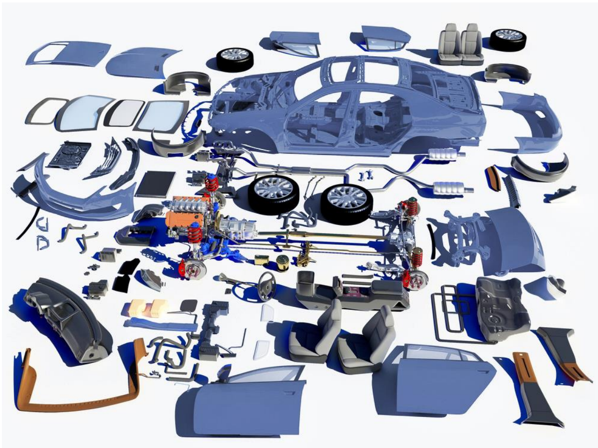
Abbildung 1: Fahrzeugzerlegung

POLARIXPARTNER erreicht mit einem 19-stufigen standardisierten Prozess bei der Zerlegung und Dokumentation ein maximales Niveau an Präzision und Aussagefähigkeit der Daten. Angefangen im Einbauzustand bis hin zur Verpackung des Bauteils nach der Demontage. Als Endergebnis wird, neben der Stückliste mit Bauteilgewichten, -abmaßen, -materialien und -bildern, eine transparente Detaildokumentation über den Einbau- und Zusammenbauzustand eines jeden Bauteils und/oder Baugruppen (Modulen) übergeben.